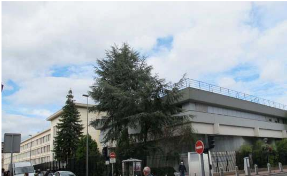
Issy-les-moulineaux, hier. Le campus qu'Orange Labs devrait libérer en 2016, en centre-ville, pourrait accueillir les services du conseil régional. (LP/P.A.)

Ce terrain de 3 ha, occupé par des immeubles de bureaux et un grand parking, devrait se libérer au premier semestre 2016 avec le départ des salariés d'Orange Labs, le département recherche et développement de l'opérateur : ils vont quitter leurs 45 000 m 2 de locaux pour déménager à Châtillon où le groupe