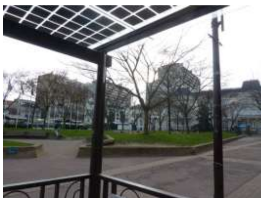
Place de la Mairie

Une majorité d'isséens juge nécessaire le réaménagement des deux grandes places de la ville : près des 2/3 des personnes interrogés pour la place de la Mairie mais seulement 55,4 % pour celle de Corentin-Celton.